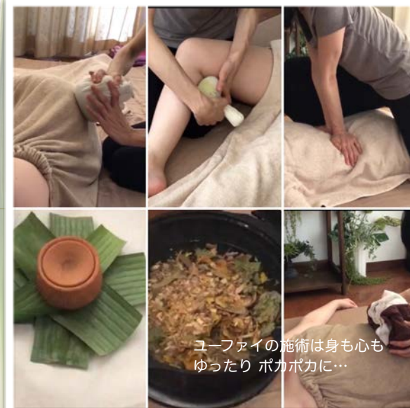
ユーファイの施術は身も心も ゆったり ポカポカに…

タイでは子どもが生まれると親族や近所さんが子守をしたり、労ったりしてくれるため、産後のママはゆったりとユーファイを受けることができます。日本にも広まって欲しいステキな風習です。ね♪